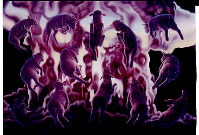
阿修羅 2016年 油彩・キャンバス P200号

本企画展では、『羊』をモチーフとした新作、近作を中心に、選りすぐりの約50点を一堂に展示いたします。泉谷淑夫の世界をお楽しみください。