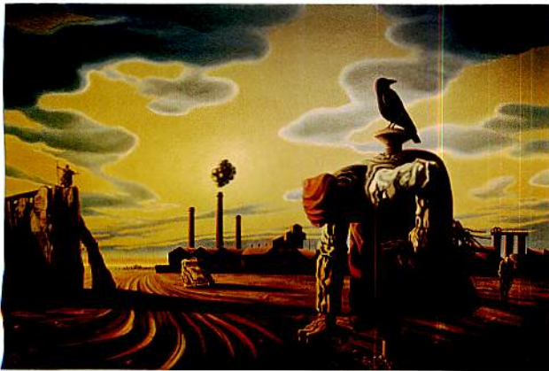
慈陽のモニュメント 1976年 油彩・キャンバス P80号