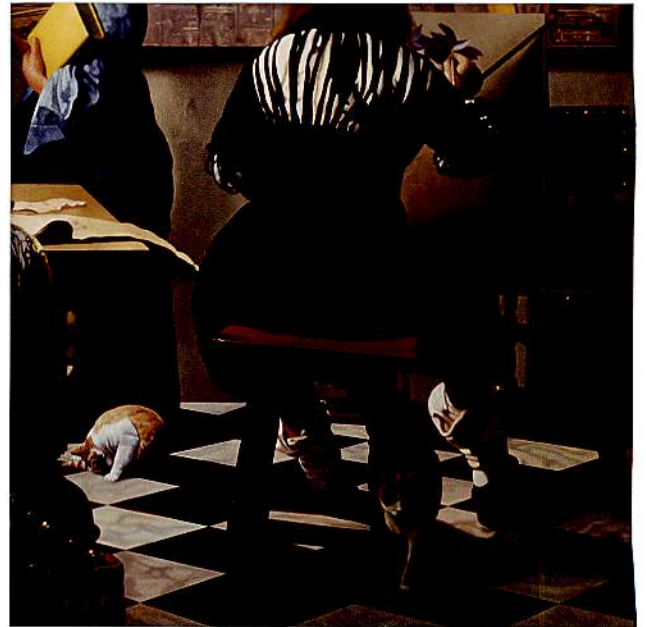
フェルメールの絵に忍びこんだ猫たち・画室 2013年 油彩・キャンバス S100号