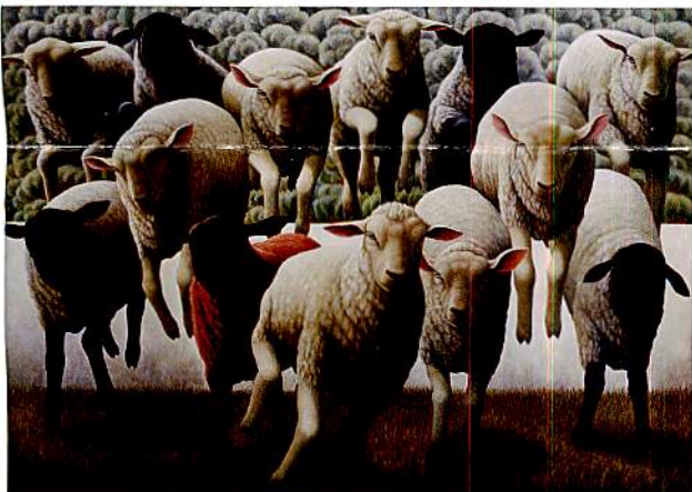
EMERGENCY 2016年 油彩・キャンバス P150号